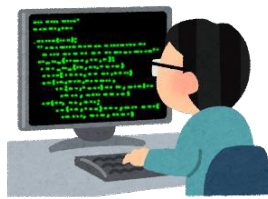
(ア) ソフトウェア 開発委託費