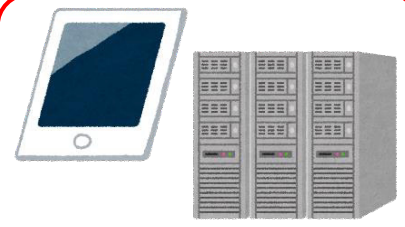
(ウ) ハードウェア購入費 及び使用料